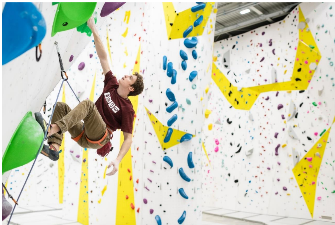
Dans les grandes lignes, la salle restera la même. Mais les équipes Grimper.ch travaillent tout de même sur quelques petites surprises.