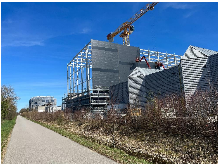
Début avril, les équipes sont à pied d'œuvre et les travaux avancent bien.